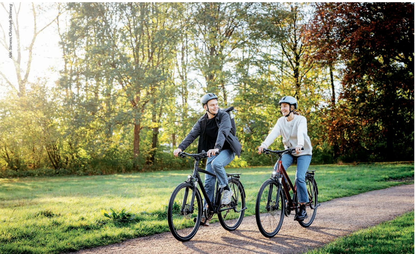
Abb. Stevens/ Christoph Steinweg

Egal, ob Sie nach einem günstigen Allrounder für Stadt und Ausflüge, robusten und langlebigen Packesel oder flotten Flitzer suchen – auf den folgenden Seiten haben wir Ihnen eine interessante Auswahl an aktuellen Modellen zusammengestellt. So sind Sie für die kommende Radsaison und jedmöglichen Einsatzzweck von gemütlichem Flussradweg-Touring über anspruchsvolle Alpenüberquerungen bis hin zur abenteuerlichen Querfeldeintour abseits der befestigten Straße optimal beraten. ◀