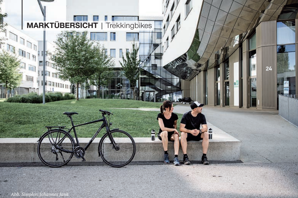
Abb. Simplon/ Johannes Jank

Bild oben | Mit einem Trekkingbike ist man auch für urbane Entdeckungen bestens gerüstet. Bild oben rechts | Reibungsloser Fahrspaß dank Riemenantrieb.