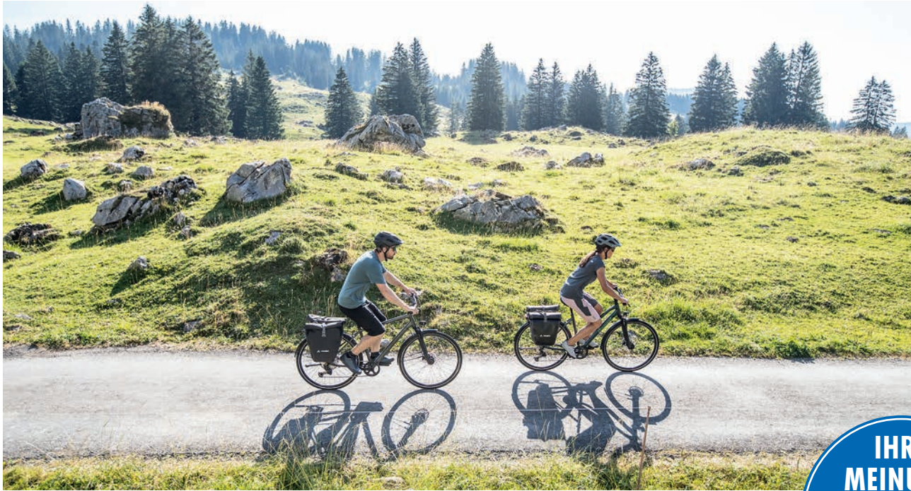
Abb. Diamant/Matthias Schlegel