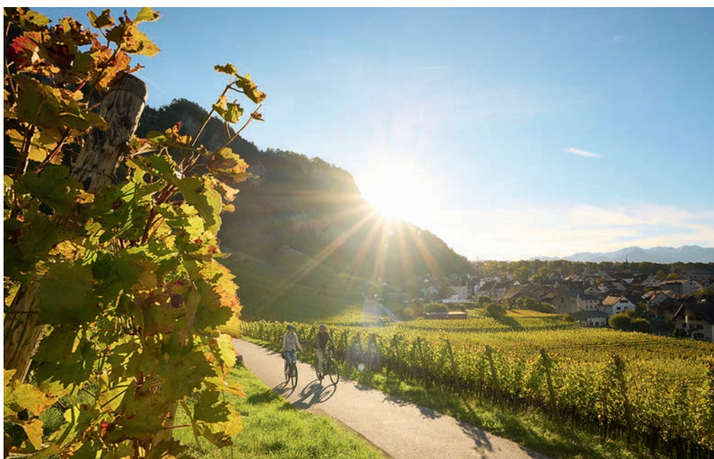
Bild links | Schönheiten entlang des Rheins vom Sattel aus genießen – hier in Rheinfelden.

Bild ganz oben | Im landschaftlich äußerst reizvollen Domleschg im Schweizer Kanton Graubünden befindet sich das Schloss Ortenstein (Baujahr um 13. Jahrhundert).