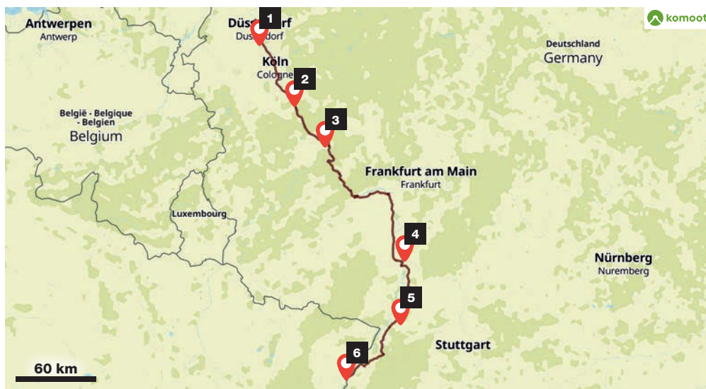
KARTE: Von Düsseldorf (1) über Bonn (2), Koblenz (3), Mannheim (4) und Karlsruhe (5) bis nach Kehl (6) führt die Strecke entlang des Rheins.

romantischer-rhein.de nrw-tourismus.de rlp-tourismus.com