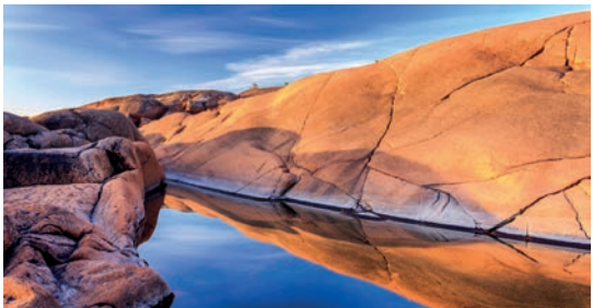
FINNLAND REISETIPP ÅLAND-INSELN