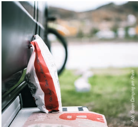
Abb. Green Camping am Rhein