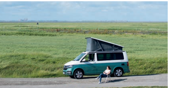
NIEDERLANDE AUF NACH FRIESLAND