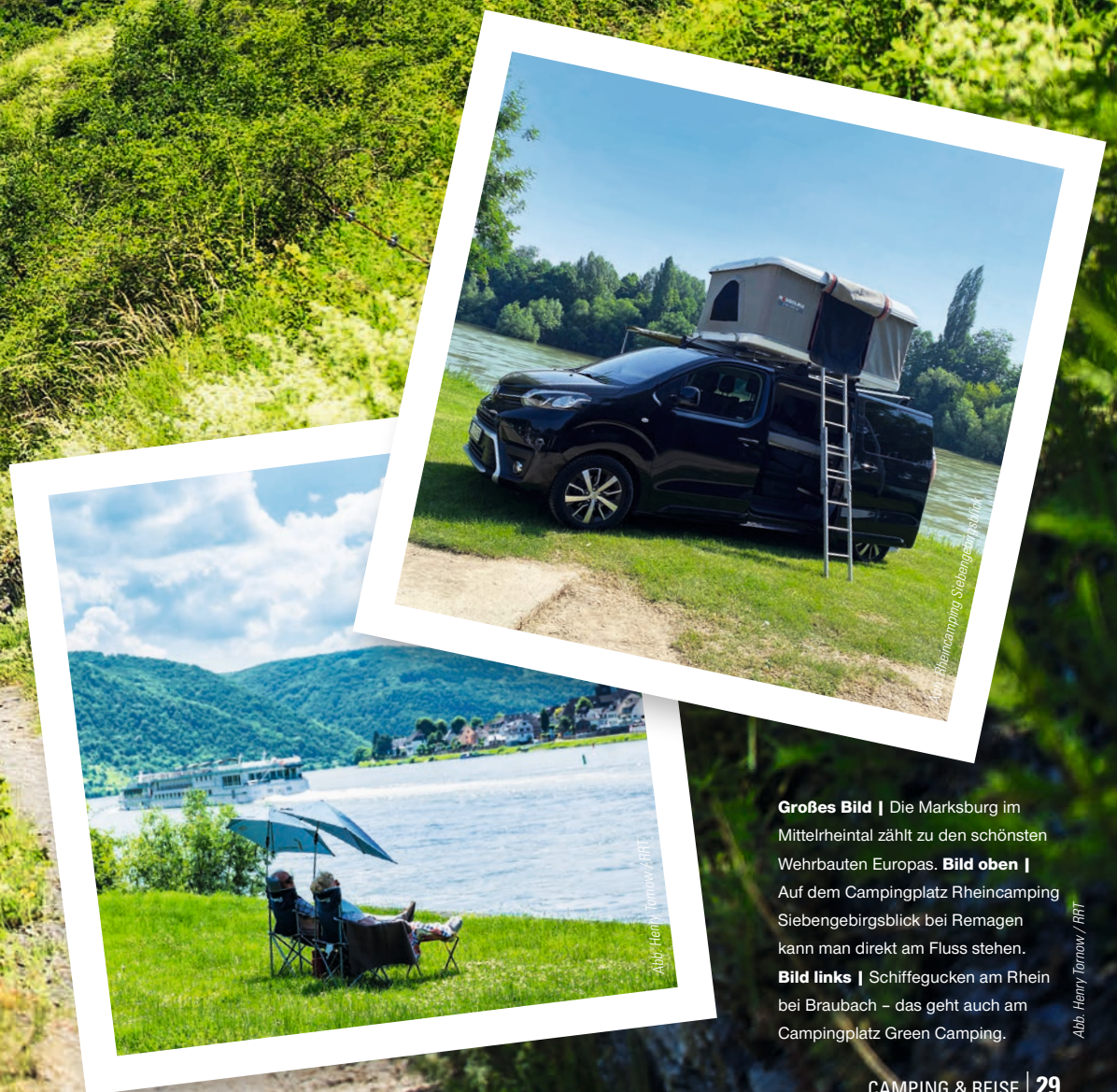
Großes Bild | Die Marksburg im Mittelrheintal zählt zu den schönsten Wehrbauten Europas. Bild oben | Auf dem Campingplatz Rheincamping Siebengebirgsblick bei Remagen kann man direkt am Fluss stehen. Bild links | Schiffegucken am Rhein bei Braubach – das geht auch am Campingplatz Green Camping.