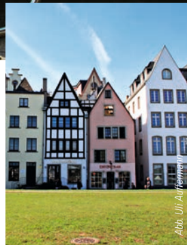
Bild oben | Unbedingt lohnenswert ist ein Besuch der Domstadt Köln, deren schöne Altstadt sich bis zum Rheinufer erstreckt.

Das milde Klima lässt den Rhein nur selten zufrieren, Treibeis kommt jedoch häufiger vor. Seine Inseln werden etwa bis zum Rheinknie bei Bingen »Aue« genannt, auf dem weiteren Weg Richtung Nordseeküste heißen sie »Werthe«.