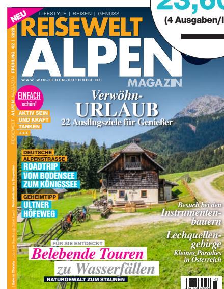
Abb. Campingsterne.at/Peter Maier