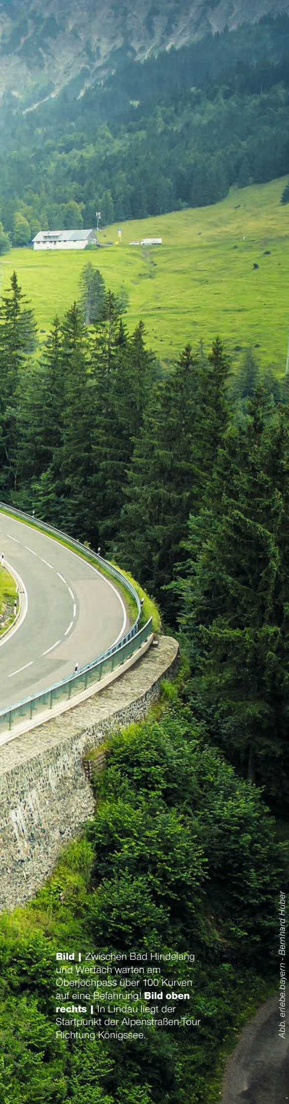
Bild | Zwischen Bad Hindelang und Wertach warten am Oberjochpass über 100 Kurven auf eine Befahrung! Bild oben rechts | In Lindau liegt der Startpunkt der Alpenstraßen-Tour Richtung Königssee.