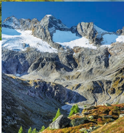
Bild ganz oben | Ganz großes Kino an den Krimmler Wasserfällen! Sie sind die höchsten in Österreich und vielleicht auch die schönsten. Bild oben | Einen Großteil des Wassers beziehen die Wasserfälle von den Gletschern. Bild oben rechts | Die Krimmler Wasserfälle liegen am Westrand des Nationalparks Hohe Tauern und sind eines seiner Highlights.

► Hat man die Wahl, dann besucht man die Krimmler Wasserfälle im Juni oder Juli an einem Schönwettertag bei hochsommerlichen Temperaturen. Hoch oben auf den Bergen des Nationalparks Hohe Tauern und in den angrenzenden Zillertaler Alpen schmelzen dann die letzten Schneereste des vergangenen Winters dahin und auch die Gletscher geben von ihrem Volumen ab.