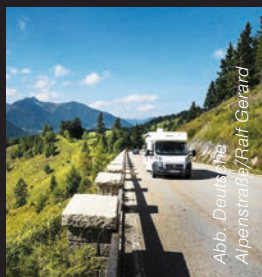
Abb. Deutsche Alpenstraße/Ralf Gerard