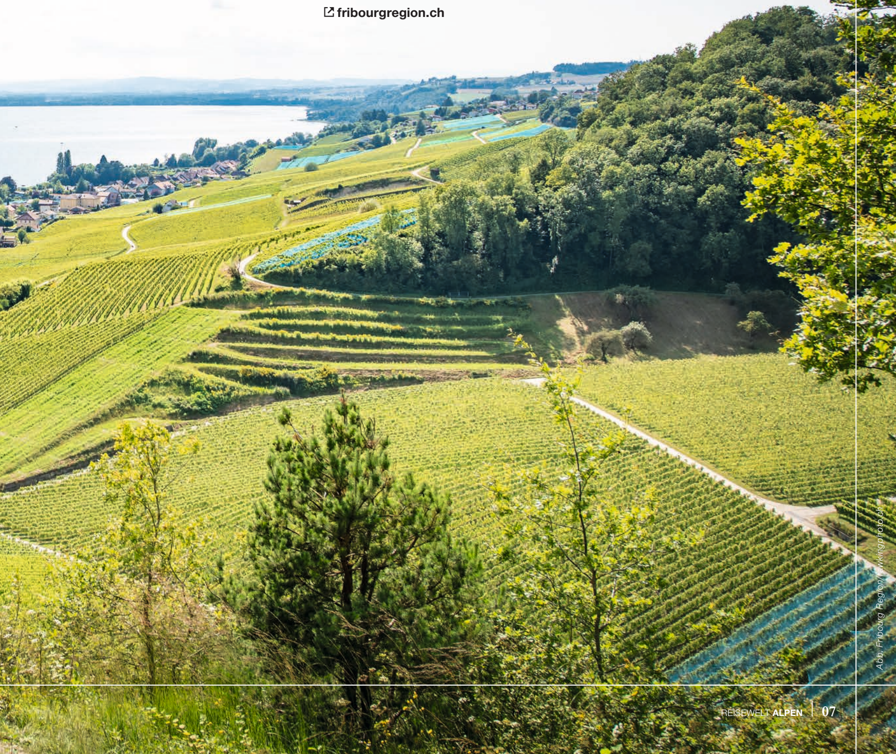
Abb. Fribourg Region / walkingphoto.ch