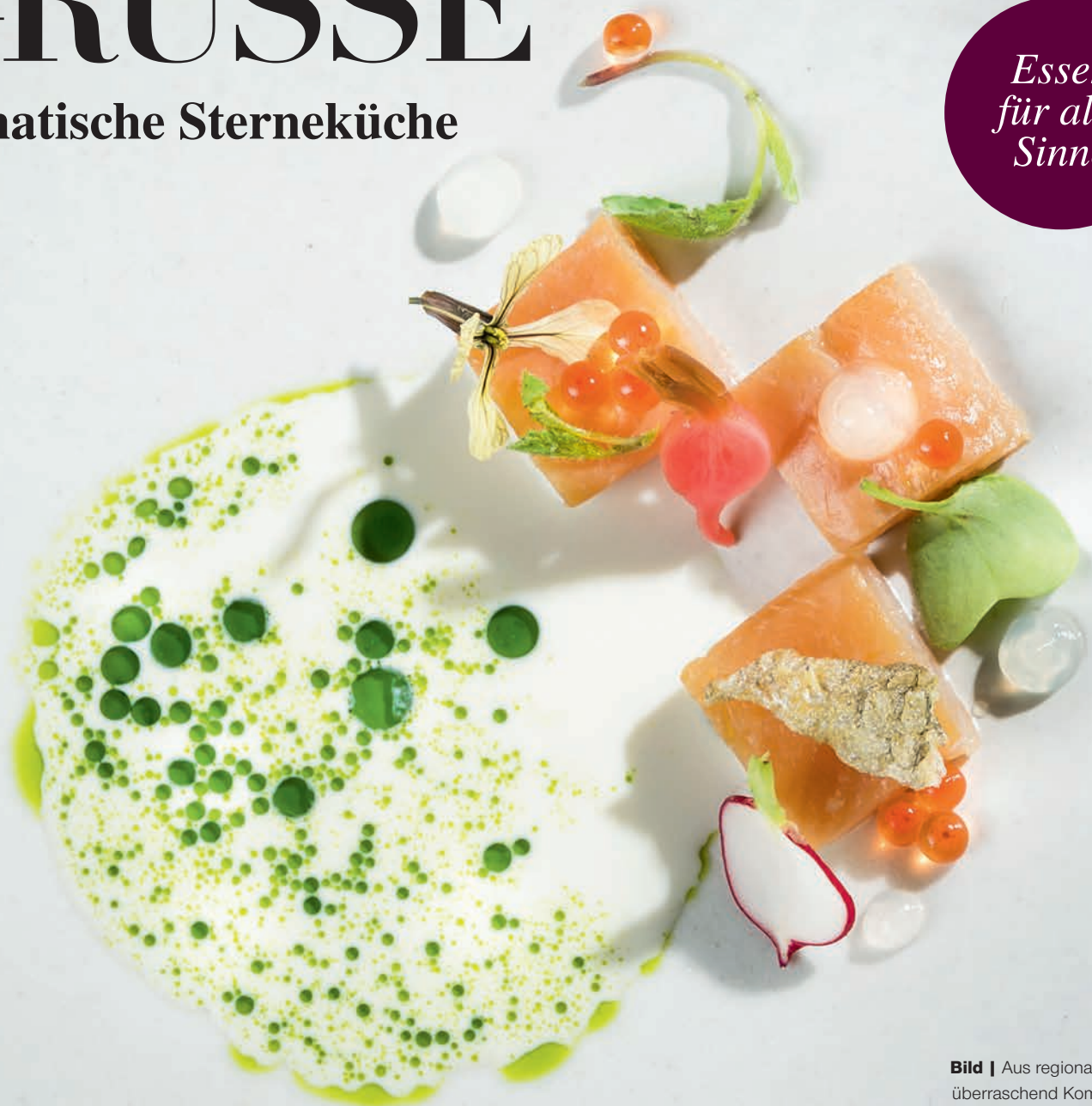
Bild | Aus regionalen Zutaten überraschend Kompositionen zaubern: Das schmeckt man in jedem Gericht aus Stephan Zippels Küche im Haubenrestaurant 1908.