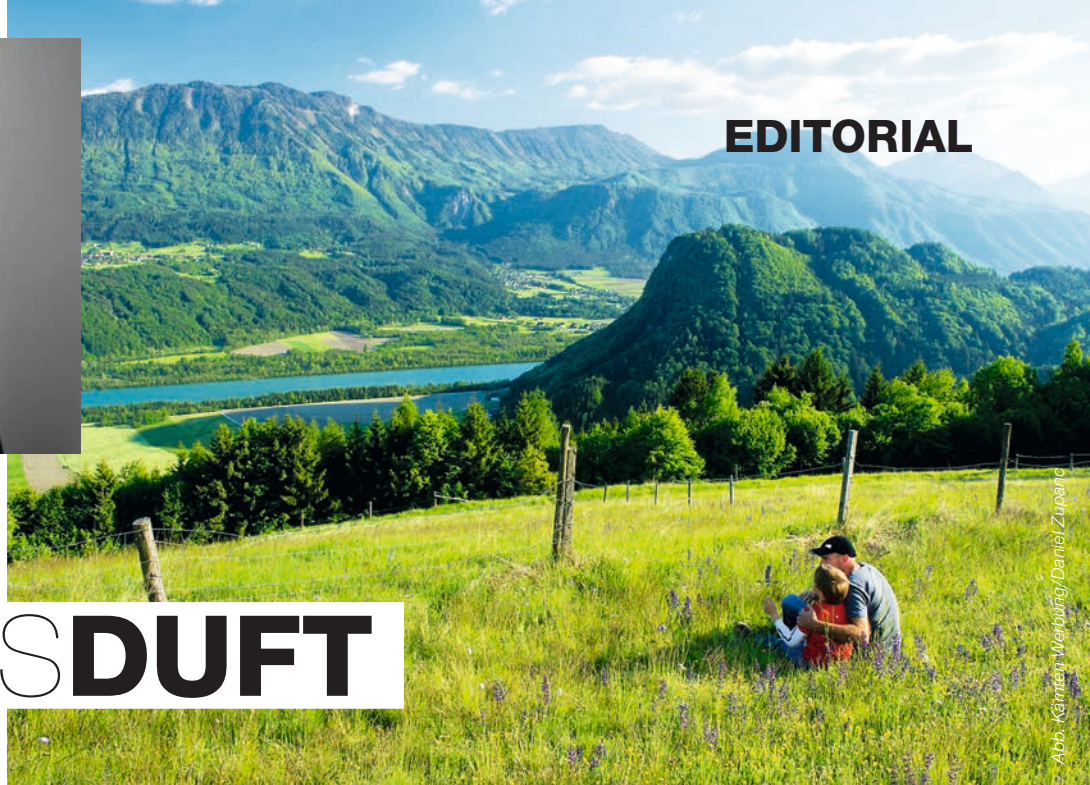
Abb. Kärlin Werbung/Daniel Zupanc