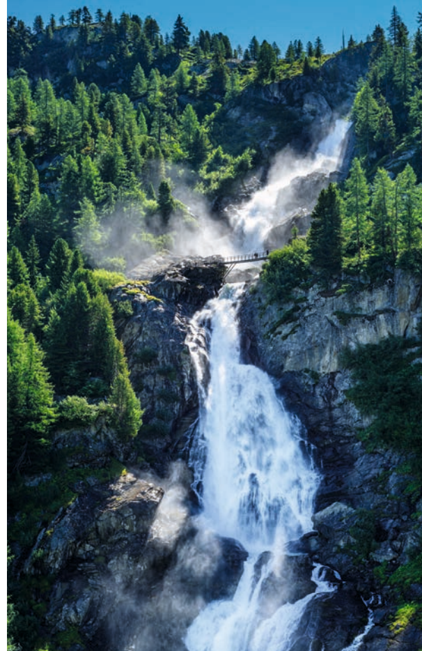
Bild oben | Die riesigen Kaskaden der Rutorfälle in Italien sieht man schon von Weitem. Bild linke Seite | Aber auch aus der Nähe sind die gischenden Wassermassen beeindruckend – zumal auch der Fernblick auf den Mont Blanc und die Grandes Jorasses das »Erlebnis Rutor« bereichern.

Manche der TOP 6 sind leicht erreichbar, zumindest die unterste Wasserfallstufe ist meist mit einem kurzen Spaziergang zu sehen. Bei manchen lohnt es sich aber, einen ganzen Tag einzuplanen, um auch die höher liegenden Stufen zu erwandern und immer neue Blickwinkel zu bekommen. Beim Krimmler Wasserfall, beim Engstligenfall, bei den Rutorfällen und den Reinbachfällen ist die Wanderung bis ans obere Ende der Stufen reizvoll und absolut empfehlenswert. Kurz: Die Wasserfälle sind im Sommer ein lohnendes Ziel, erfrischend und beeindruckend.