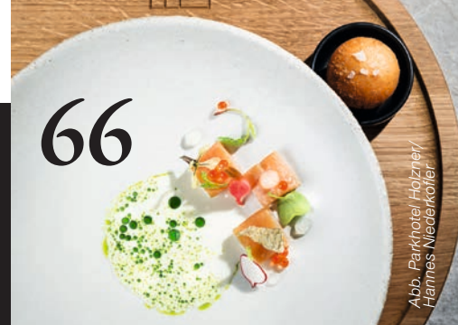
Abb. Parkhotel Holzner / Hannes Niederkolter