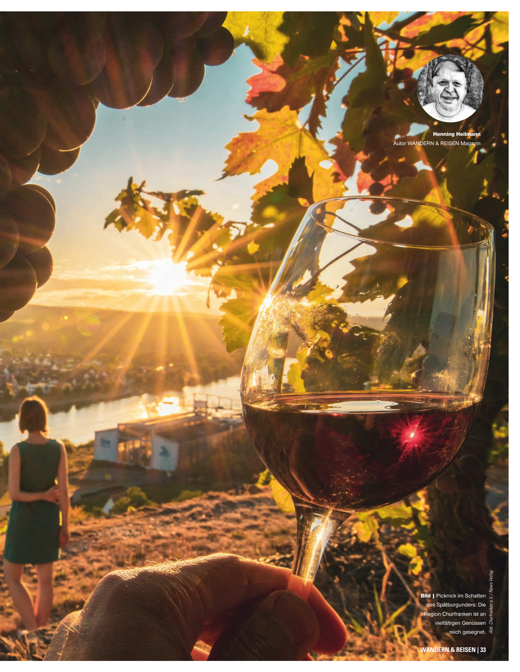
Bild | Picknick im Schatten des Spätburgunders: Die Region Churfranken ist an vielfältigen Genüssen reich gesegnet.